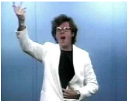
"Opera punk". video DVcam. 7 minutos. 1998