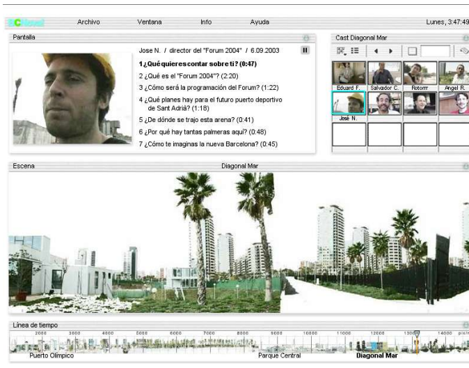
"José Nadie" intervención para Bcnova. 2004.