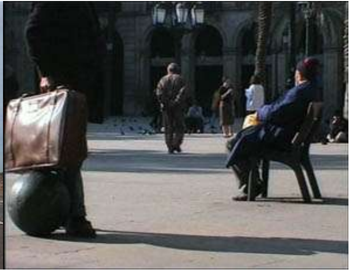
"Real", 23 minutos BTV- UAB, Betacam y DVCam, 2000.