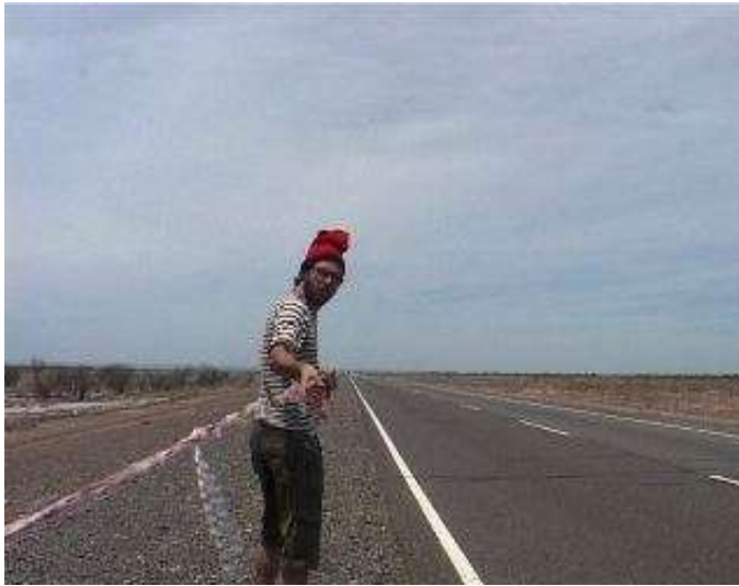
"Soc català, en Argentina" 50 minutos, DVCam, 2006.